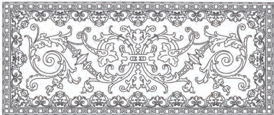
Dibujó, Ramón León (basado en el diseño de Francisco de Armenta para la Carreta de Triana). 1 de 8 paños simétricos para la cubierta del techo en plata de ley grabada y recercada.